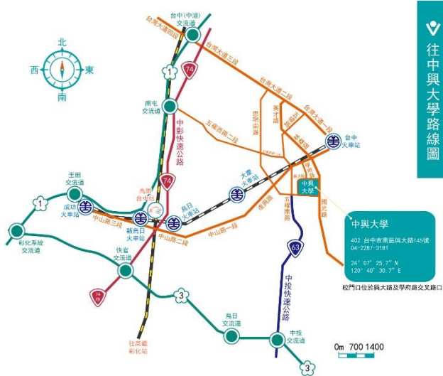
➤ 圖書館校園指引圖