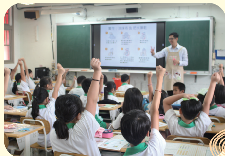
小朋友現場踴躍參與